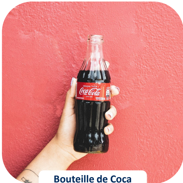
Bouteille de Coca Cola, TMA926811

Voici quelques dessins industriels connus qui sont actuellement protégés par des marques de commerce :