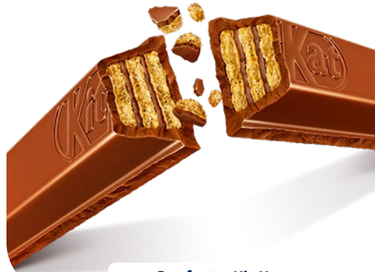
Gaufrette Kit Kat, TMA601833