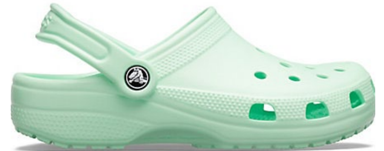
Souliers Crocs, TMA1009981